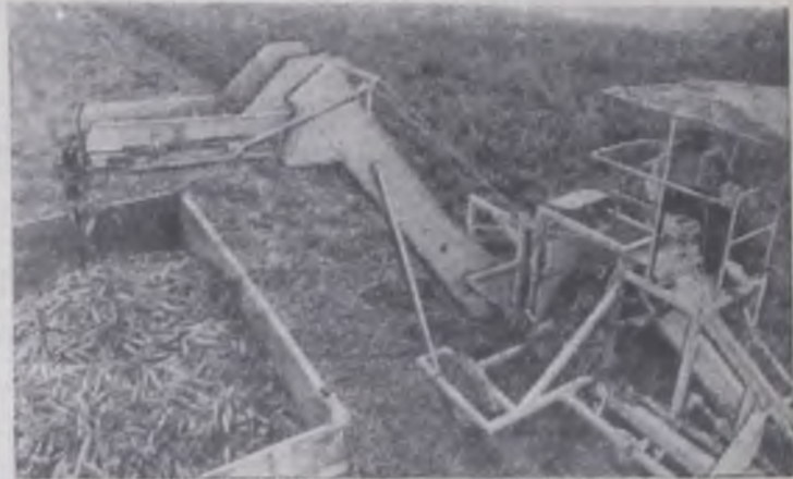
МОСКОВСКАЯ ОБЛАСТЬ. В колхозе «Путь к коммунизму» Истринского района выращен хороший урожай моркови: по 300 центнеров с гектара. В прошлые годы уборка ее ручным методом была очень трудоемким процессом, а в этом году морковь убирают комбайном. Производительность труда увеличилась в восемь раз.