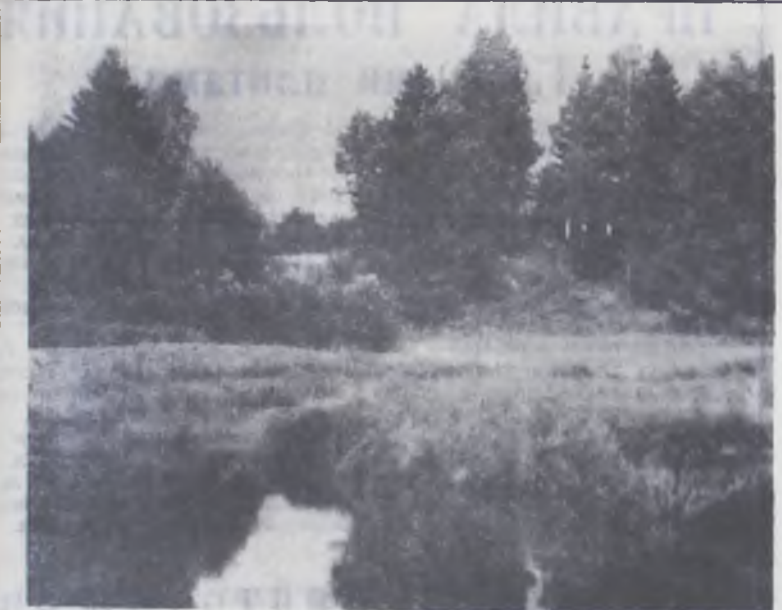
Когда же, как не в октябре, после затяжного ненастья бывает столь чистое небо, столь ясны рассветы? Рощи раньше восхода светятся, продутые ветрами насквозь. (И. Полуянов, «Месяцеслов».)

воздуха опускалась до 20 градусов мороза, а в 1966 и 1974 годах в начале месяца ртутный столбик поднимался до 22 градусов тепла. Раннее покрытие поверхности земли снегом — 3 октября — наблюдалось в 1925, 1928, 1930 годах, но затем он стаивал. А в октябре 1946 года снежный покров образовался 12 числа и остался лежать до весны. Но обычно осень укрывает землю снежным покрывалом, хотя и не устойчивым, в конце третьей декады. Т. ШУМОВА, начальник метеостанции.