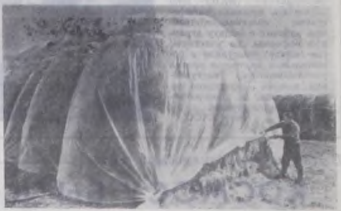
ЛЕНИНГРАДСКАЯ ОБЛАСТЬ. Пасмурная погода и дождь не помеха заготовке кормов в совхозе «Новое время». Первыми в области они внедрили новую технологию сушки сена. На площадку рядом с молочным комплексом транспортируются с поля прессованные кипы сена. Из этих упаковок складываются скирды геометрической формы, с «внутренним коридором». В торце скирды, накрытой полиэтиленовой пленкой, устанавливается мощный вентилятор. Теплый воздушный поток досушивает сено.