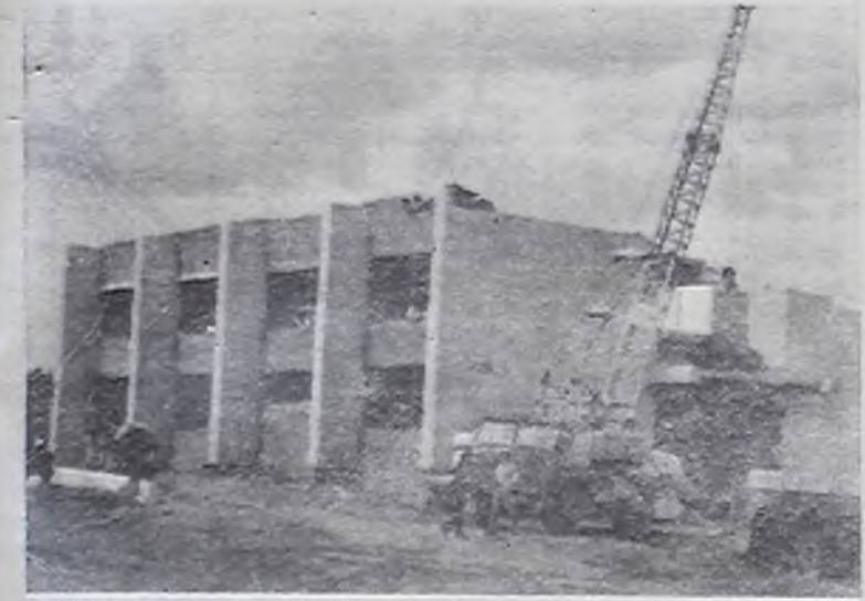
НА СНИМКЕ: строительство сельского Дома культуры в колхозе «1-е Мая» ведет бригада А. И. Аббасова.