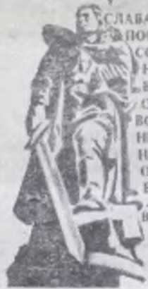
Плакат художника О. Маслякова.