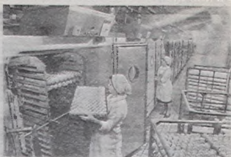
Внедрение бригадного подряда в основных цехах, взаимоматемность, позволили повысить производительность труда, значительно снизить себестоимость продукции.

Фабрика — детище нынешней пятилетки. Молодежный коллектив успешно осваивает производственные мощности.