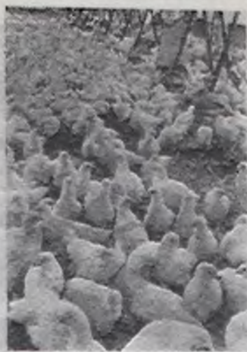
АРХАНГЕЛЬСКАЯ ОБЛАСТЬ. Беспробойно работает конвейер Нилдомской бройдерной фабрики. Ежедневно предприятие отправляет в торговую сеть более двадцати тонн диетического мяса.

И. МАКАРОВ, секретарь парткома Тотемского леспромхоза.