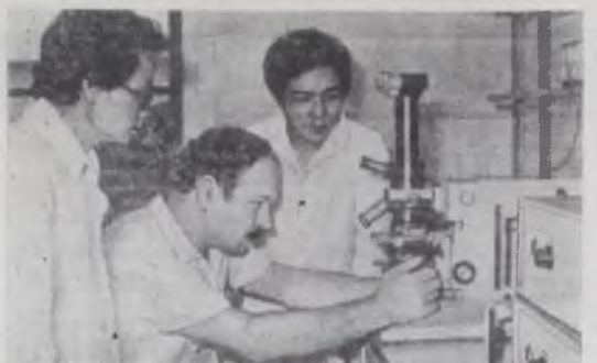
В северной вьетнамской провинции Винфуй — главным заводским районом страны — открылся научно-исследовательский институт чая. Он создан с помощью и при техническом содействии Советского Союза. НА СНИМКЕ: советские и вьетнамские специалисты в одной из лабораторий института.