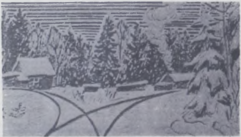
43-й километр Пятовской УЖД.