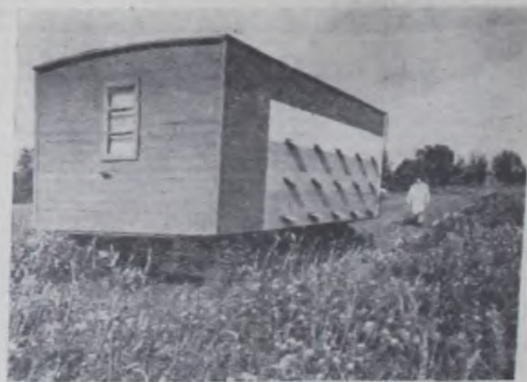
ГРОДНЕНСКАЯ ОБЛАСТЬ. На промышленную основу переведено пчеловодство в Мостовском районе. Здесь создано объединение, пайщиками которого стали 17 колхозов и совхозов.

В объединении внедряются прогрессивные формы организации труда. Обслуживают пасеку два звена, за которыми закреплены транспортные средства. Оборудован передвижной павильон для содержания 30 пчелиных семей. Такая пасека на колесах способствует значительному увеличению медосбора.