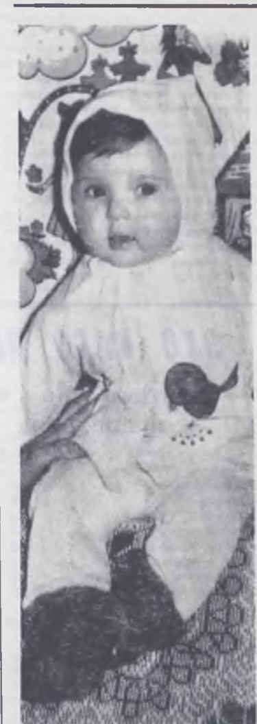
Мама пришла!