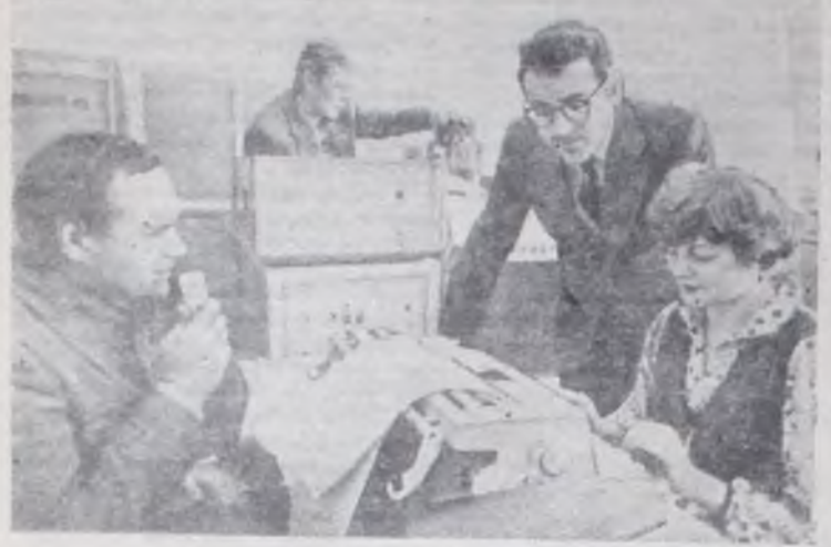
МОСКОВСКАЯ ОБЛАСТЬ. На кафедре применения электрической энергии Всесоюзного сельскохозяйственного института заочного образования создана оригинальная электронная машина «Сезам-4», способная распознавать команды, поданные голосом человека.

Получив команду, машина выдает соответствующий сигнал на световое табло, а в недалеком будущем, соединенная с исполнительными устройствами, она даст возможность через микрофон управлять различными технологическими процессами.