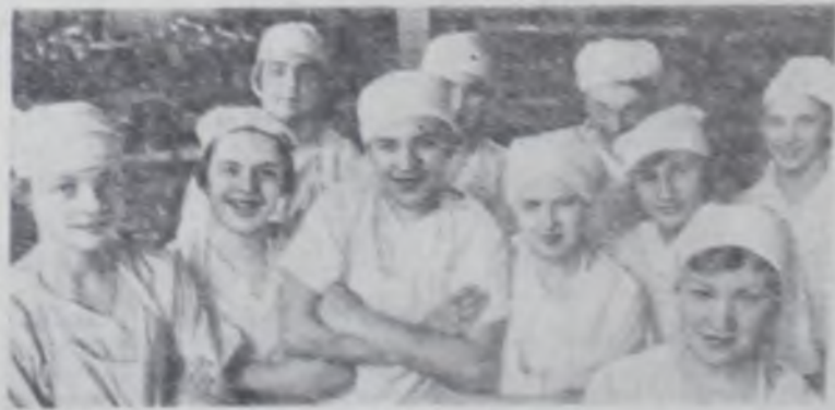
Что такое хлеб?

В рекомендации семинара записано, что родительские комитеты школ призваны оказывать помощь педагогическим коллективам в обучении и воспитании учащихся. Они содействуют осуществлению всеобщего обязательного среднего образования, организации подвоза учащихся в школу, обеспечению школьников горячим питанием. Оказывают влияние на «нерадивых» родителей, помогая им в воспитании детей, изучают и пропагандируют лучший опыт семейного воспитания, решают многие другие вопросы.