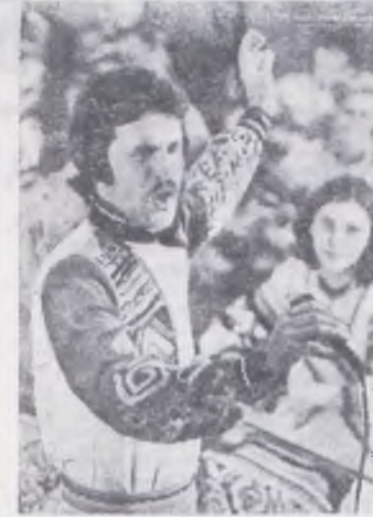
Ансамбль гусликов «Серебряная струна» — новый коллектив Псковской филармонии. Гусли — старинный русский инструмент — издавна бытовали на Псковщине.

Учитывая, что проект был утвержден с нарушением установленного порядка, предложено проектной организации переработать проект в соответствии с существующими положениями по разработке проектов генеральных планов городов, имеющих памятники истории и культуры, и представить его на рассмотрение Госстроя РСФСР.