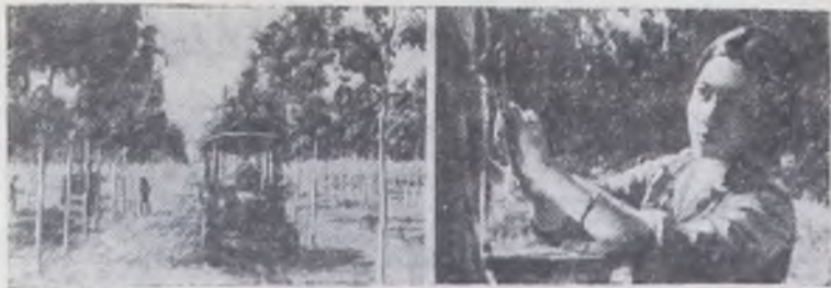
Каучуковые плантации в южной вьетнамской провинции Донгнай — крупнейшие в СРВ. Издавна здесь выращиваются гевен, из белого сока которых получают латекс — ценное техническое сырье, пользующееся большим спросом на мировом рынке.

Во время войны в результате применения американской авиацией отравляющих веществ донгнайским плантациям был нанесен огромный ущерб. Сейчас осуществляется комплекс мер по восстановлению и расширению плантаций.