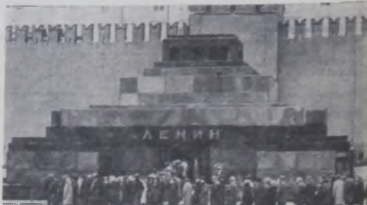
Москва. Красная площадь. У Мавзолея В. И. Ленина.

— Мы, курсанты-часовые, были свидетелями и того, как Надежда Константиновна иногда