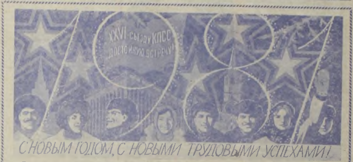
Плакат художника М. Лукьянова. Издательство «Плакат».

В добрый путь, одиннадцатая! С Новым годом, с новым счастьем, дорогие товарищи! Всем вам доброго здоровья, новых успехов в труде, учебе, творчестве!