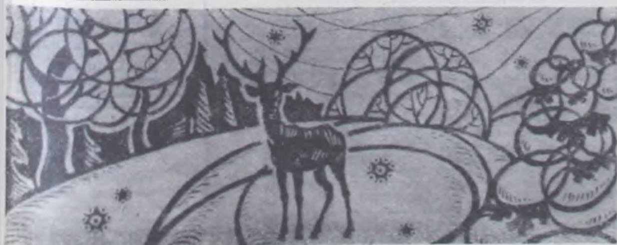
В зимнем лесу,