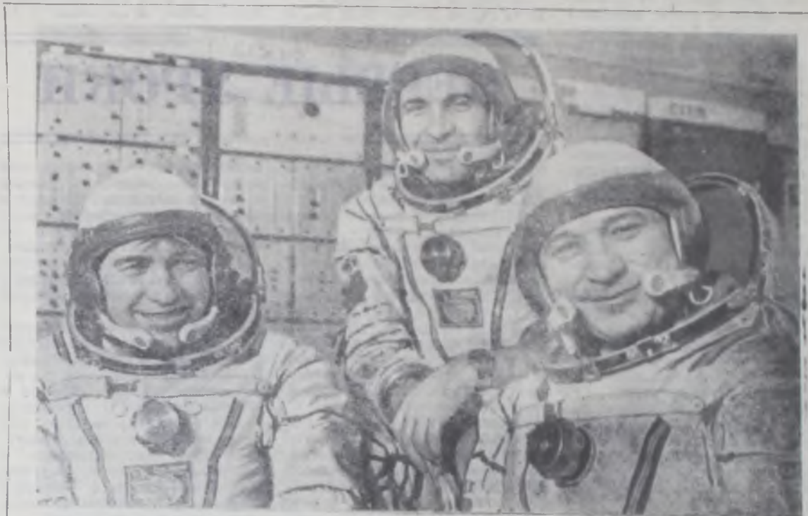
Экипаж космического корабля «Союз Т-3» (справа налево) — командир корабля Л. Д. Кизим, бортинженер О. Г. Макаров и инженер-исследователь Г. М. Стрекалов.