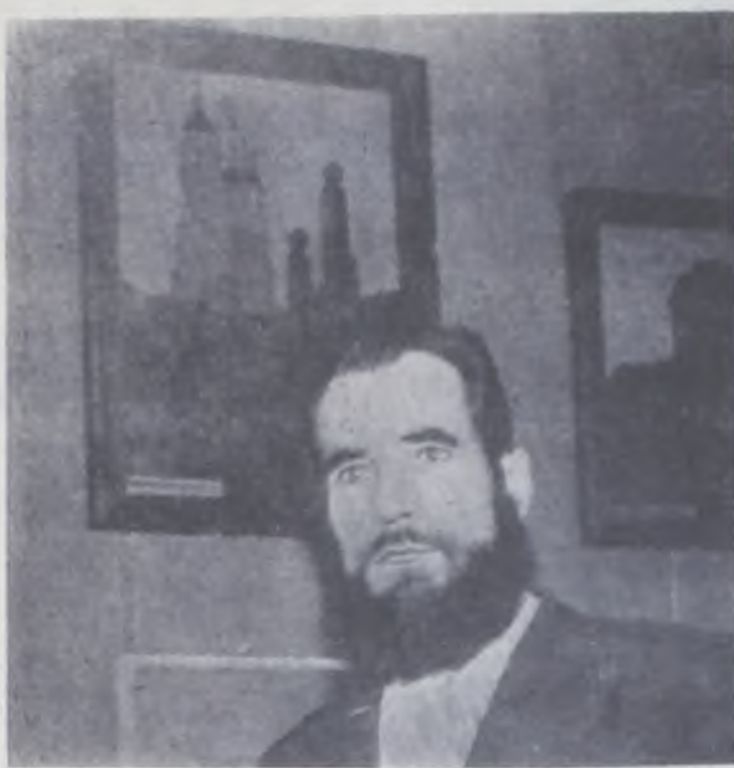
поварослевший, возмужавший в боях...

Нельзя без волнения пройти мимо портрета «Мать». В этой работе художник с большой любовью и грустью рассказывает о матери, которая до сих пор ждет с войны сына — фотография его висит на стене. В глазах матери печаль и напряженное ожидание: вот-вот распахнется дверь и войдет в дом он,