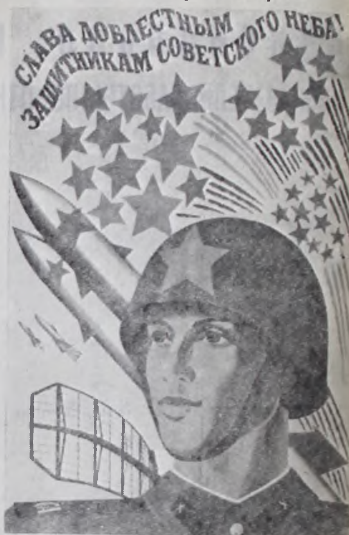
Плакат художника М. Лукьянова. Издательство «Плакат».

19 ноября — День ракетных войск и артиллерии