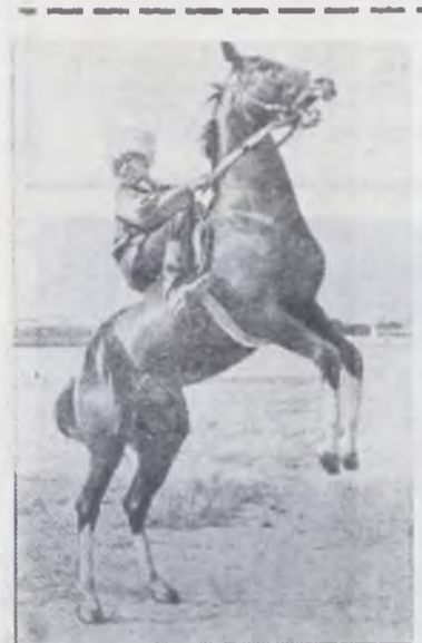
Ахалтекинцы, знаменитая порода лошадей, славится своей выносливостью, красотой и резвостью. Родины их стала территория нынешнего Туркменистана, а точнее — предгорья Копет-Дага, где жили кочевые племена ахалов и теке. Отсюда и название лошадей.

Немалую роль в выведении породы сыграли многовековой опыт и мастерство туркменских коневодов.