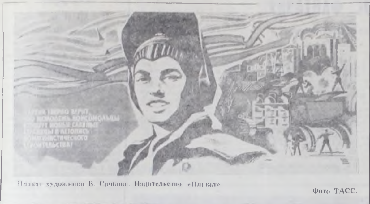
Плакат художника В. Сачкова. Издательство «Плакат».