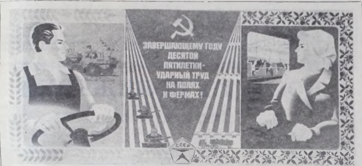
Плакат художника С. Жмуренкова. Издательство «Плакат».