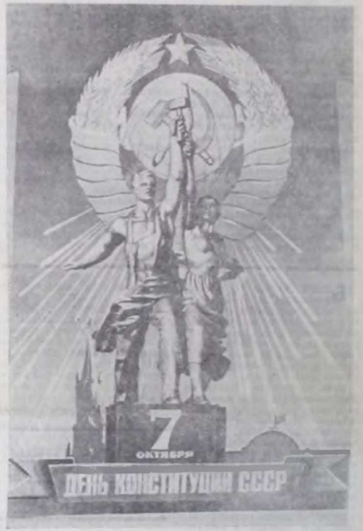
Плакат художника В. Викторова. Издательство «Плакат».

Отмечая третью годовщину новой Конституции СССР, местные Советы, депутаты, общественные организации, хозяйственные руководители должны поднять чувство личной ответственности трудящихся района за судьбу и дела своих коллективов, что является гарантией новых успехов в коммунистическом строительстве.