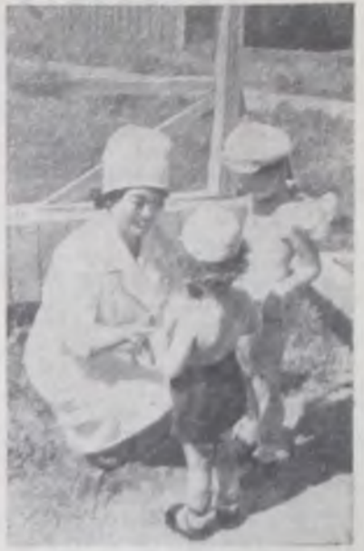
«Граждане СССР имеют право на охрану здоровья».

(Конституция СССР, ст. 42). Солнце стало союзником казахских врачей. В созданной в Алма-Ате гелиолечебнице лечат концентрированным солнечным светом.