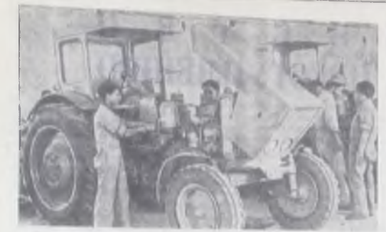
Высшие учебные заведения Эфиопии переходят на новые программы, составленные с учетом особенностей ее народного хозяйства. После начала национально-демократической революции высшие образования в Эфиопии стали общедоступными. В помещениях учебного года института страны несутся 2150 специалистов.

Учащиеся обеспечиваются жильем, коммунальными услугами, стипендия 52—63 рубля в месяц. Начало занятий с 1 сентября 1979 года