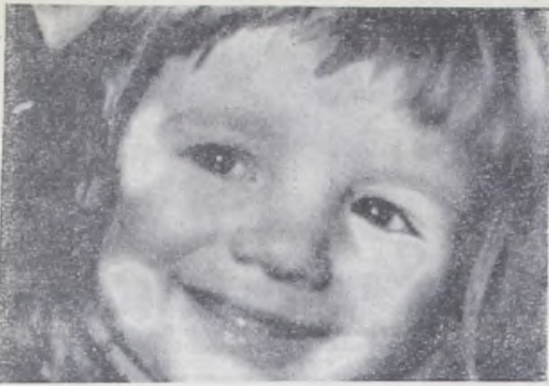
КАК ИНТЕРЕСНО!