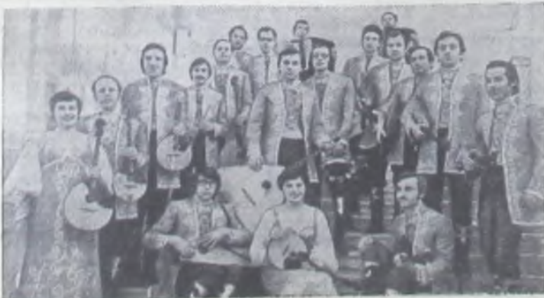
НА СНИМКЕ: ансамбль «Русские узоры».