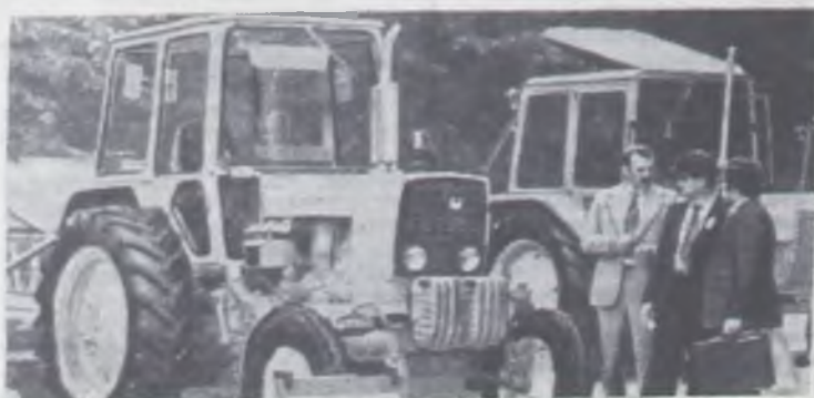
НА СНИМКЕ: универсальный пропашной трактор ЮМЗ-6АМ «Беларусь-611». Предназначен для выполнения основных сельскохозяйственных и транспортных работ.

главный агроном производственного управления сельского хозяйства.