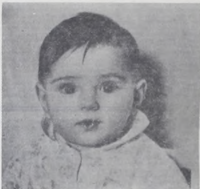
Как много в мире непонятого!