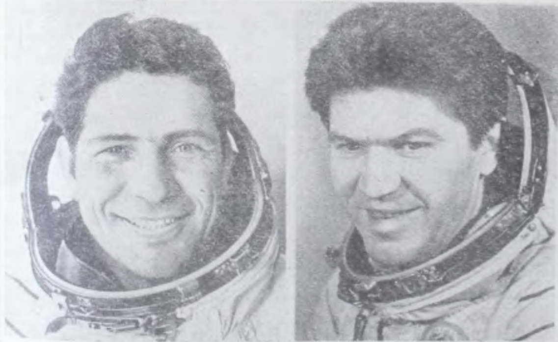
Экипаж космического корабля «Союз-32» — командир корабля подполковник Владимир Афанасьевич Ляхов (на левом снимке) и бортинженер летчик-космонавт СССР Валерий Викторович Рюмин.

ЦЕНТРАЛЬНЫЙ КОМИТЕТ КОММУНИСТИЧЕСКОЙ ПАРТИИ СОВЕТСКОГО СОЮЗА.