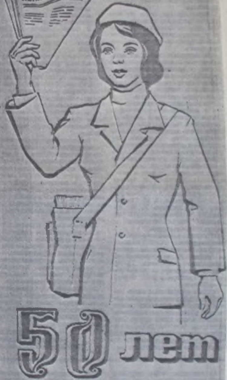
Рисунок И. ШЛОМОВИЧА.