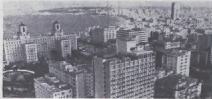
Гавана — столица Острова Свободы.