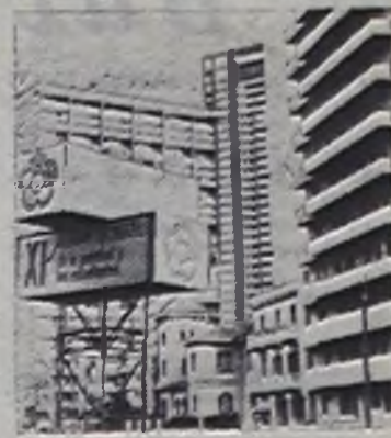
КУБА. Празднично выглядят улицы и площади Гаваны в преддверии XI Всемирного фестиваля молодежи и студентов.