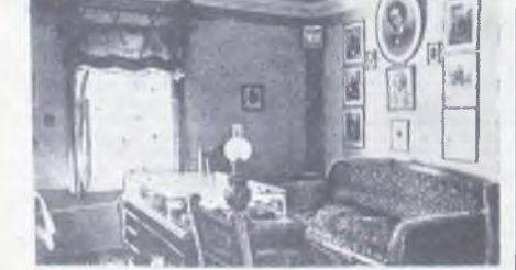
МОСКОВСКАЯ ОБЛАСТЬ. КЛНН. Государственный музей Петра Ильича Чайковского — центр пропаганды и изучения творчества великого русского композитора. Сегодня в фонде свыше 100 тысяч экземпляров. Широко используются фонды музея для пропаганды музыкальных первоначальных навыков, Болгарии и других странах.

Неиссякаем поток посетителей и музык. Свыше 120 тысяч посетителей таланта великого композитора. Был здесь концертом.