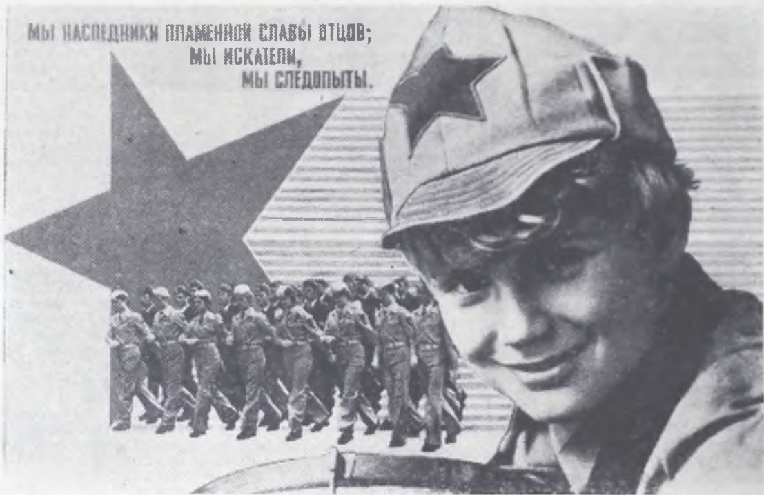
Плакат художника А. Рудковича. Издательство «Плакат».

МЫ НАСЛЕДНИКИ ПЛАМЕННОЙ СЛАВЫ ПТЦОВ; МЫ ИСКАТЕЛИ, МЫ СЛЕДОПЫТЫ.