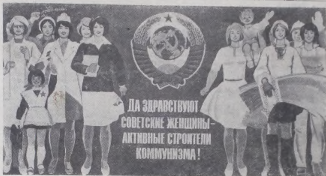
Плакат художника И. Коминарца «Да здравствуют советские женщины — активные строители коммунизма!» Издательство «Плакат».

Велики и трудны заботы, которые владеют женщиной. Она — первая хранительница жизни и мира на нашей планете. К женщинам, знаменитым и никому не известным, добрым труженицам — слова Горького: «Вся гордость мира — от Матерей!».