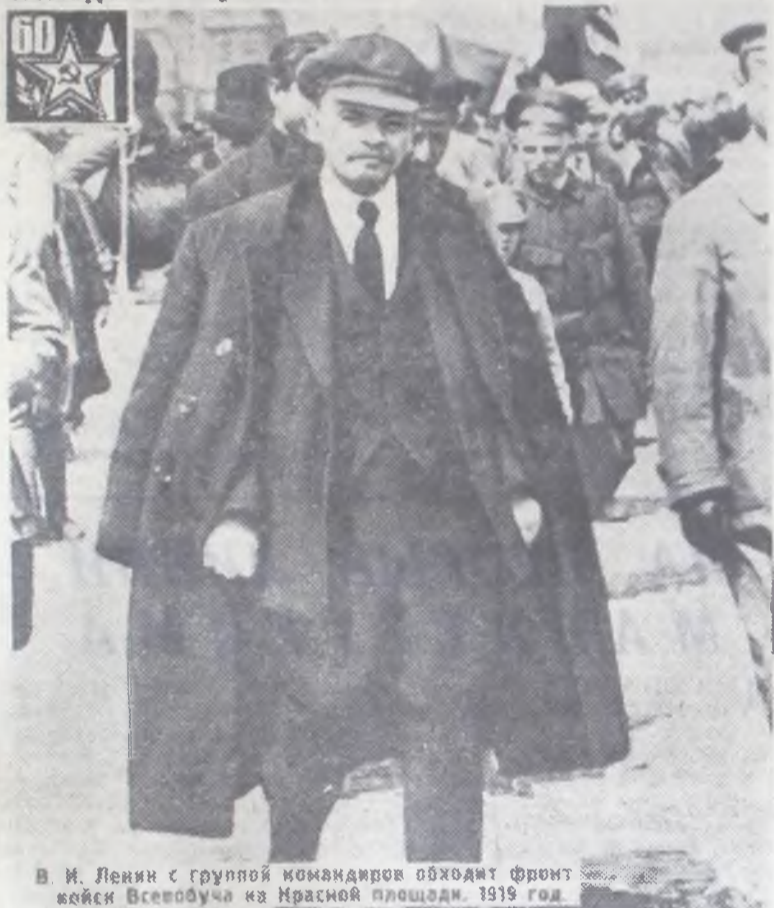
В. И. Ленин с группой командиров обходит фронт войск Всеобуча на Красной площади. 1919 год.

В. И. Ленин и Коммунистическая партия — создатели первой в мире Рабоче-Крестьянской Красной Армии, которая, разгромив белогвардейцев и интервентов, показала себя верным защитником молодой Республики Советов.