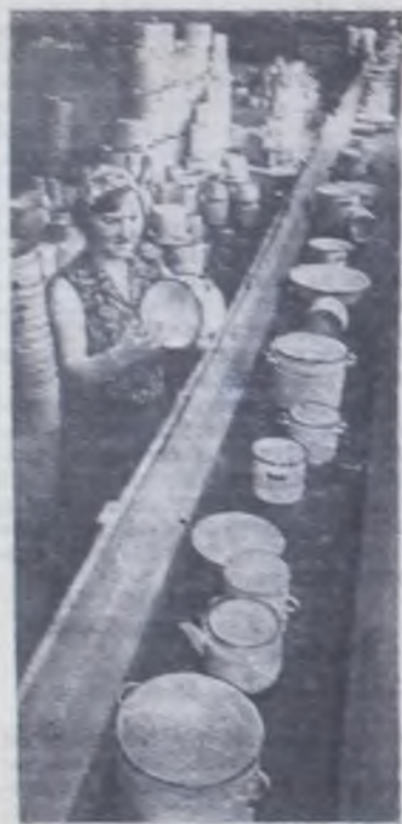
Товары — народу ХОЗЯЙКАМ НА РАДОСТЬ

ЧЕЛЯБИНСКАЯ ОБЛАСТЬ. Большим спросом у покупателей пользуется эмалированная посуда, выпускаемая цехом по производству товаров народного потребления на Магнитогорском металлургическом комбинате. В 1978 году здесь намечено изготовить посуды на 1,5 миллиона рублей больше, чем в прошлом году.