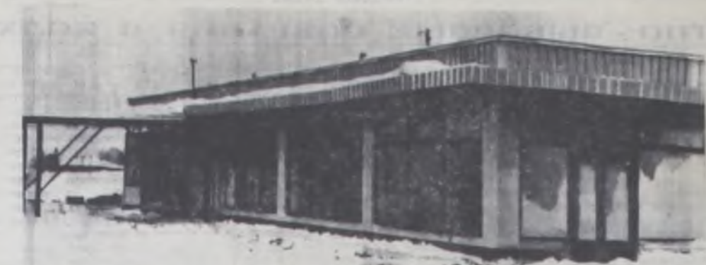
Красное здание автовокзала построили строители при въезде в Тотьму по новой автодороге. В нем светло, чисто и уютно. Как только будут оборудованы кассы, зал для пассажиров, от нового вокзала автобусы отправятся в рейсы по всем направлениям.