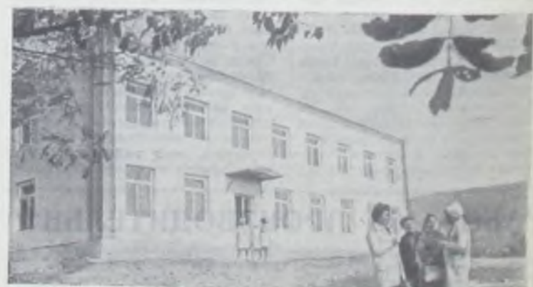
МОЛДАВСКАЯ ССР. Домом здоровья назвали жители села Селиште Ниспоренского района новое современное двухэтажное здание, в котором разместились врачебная амбулатория, молочная кухня, аптека (на снимке). Здание построено на кооперативные средства колхозов имени Калинин и имени Жданова. Планом социального развития, утвержденным Ниспоренским райкомом партии и районным Советом народных депутатов, предусмотрено строительство в селах еще пяти Домов здоровья.

Н. ЛАПИНА, руководитель агитколлектива партийной организации колхоза «Никольский».