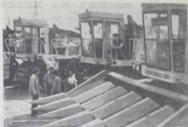
ХЕРСОН. С конвейера комбайнового завода имени Г. И. Петровского сошла промышленная партия самоходных кукурузоуборочных комбайнов «Херсон-200». Машины изготовлены для государственных испытаний в широких полевых масштабах.