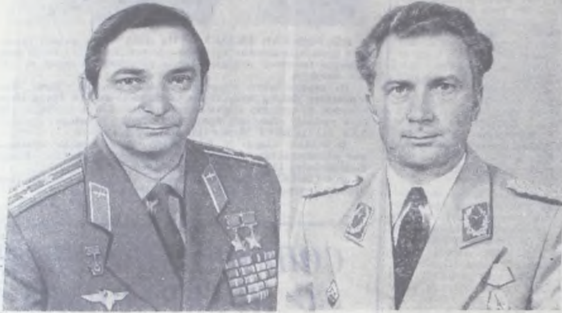
Командир международного экипажа космического корабля «Союз-31» летчик-космонавт СССР дважды Герой Советского Союза полковник В. Ф. Быковский.