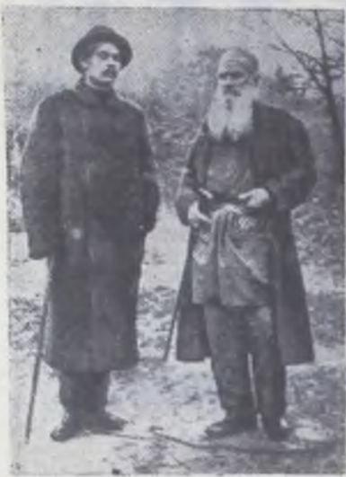
НА СНИМКЕ: Л. Н. Толстой и А. М. Горький в Ясной Поляне (1901 г.)

К 150-летию СО ДНЯ РОЖДЕНИЯ Л. Н. ТОЛСТОГО