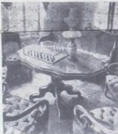
НА СНИМКЕ: уголок большого зала на втором этаже. На первом плане — овалы стола красного дерева и шахматы, принадлежащие Л. Н. Толстому.

Дом-усадьба расположена в большом саду-парке с липовыми аллеями.