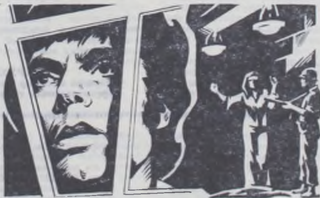
Кадр из фильма «Ночь над Чили».