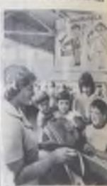
ЛЕНИНГРАД. В комсомольском комитете на Васильевском острове...