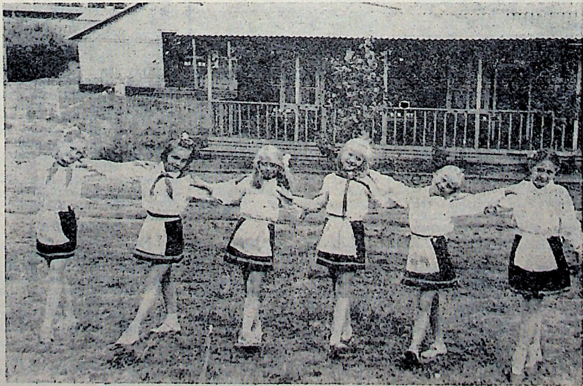
НА СНИМКЕ: танцевальная группа агитбригады лагеря «Колосок» на репетиции.