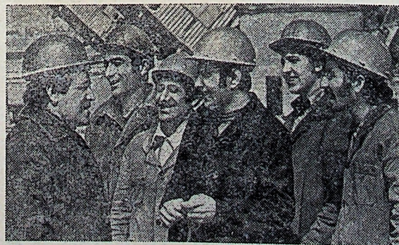
АРМЯНСКАЯ ССР. На Разданском горнохимическом комбинате работает большой многонациональный коллектив. Вместе с армянскими рабочими здесь трудятся русские и украинцы, азербайджанцы и белорусы, ассирийцы, дагестанцы — пред-

которые покажут новые постановки, посвященные юбилею Великого Октября.