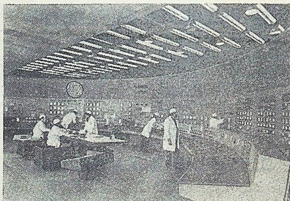
АРМЯНСКАЯ ССР. В Араратской долине сооружается первый атомный энергетик Закавказья — Армянская АЭС. В канун юбилейного года был введен в действие первый энергоблок мощностью 405 тысяч киловатт. Ток, вырабатываемый АЭС, поступает в объединенную Закавказскую энергосистему. НА СНИМКЕ: пульт управления Армянской АЭС.

Десять лет назад была создана первая в Армении электронно-вычислительная машина «Наприт». А сейчас специалисты разрабатывают быстродействующий компьютер четвертого поколения.