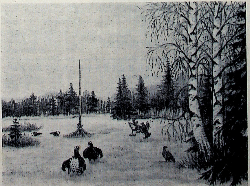
Рисунок С. ЗАЙЦЕВА.