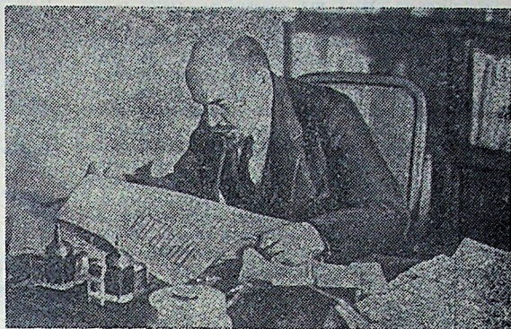
В. И. Ленин в рабочем кабинете в Кремле, Москва, октябрь 1918 года.