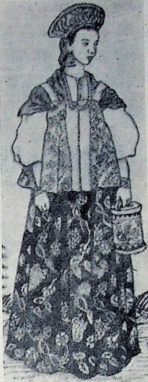
Иван Яковлевич Билибин — один из выдающихся русских художников родился в 1876 году в Тархове под Сестрорецком близ Петербурга. Родители препятствовали исполнению его мечты стать художником и поэтому по окончании гимназии он поступает на юридическое отделение Петербургского университета. Одновременно

(К 35-ЛЕТИЮ СО ДНЯ СМЕРТИ И. Я. БИЛИБИНА)