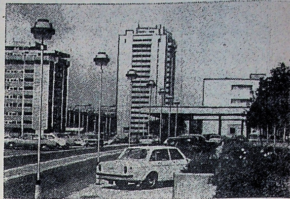
Самым крупным районом югославской столицы является Новый Белград (на снимке). По существу это целый город, рассчитанный на 250 тысяч жителей.