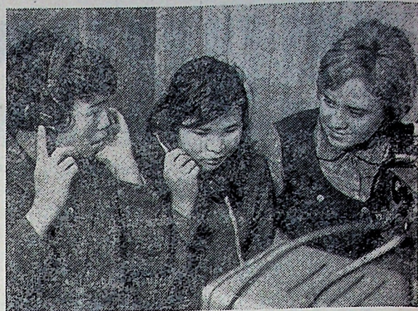
Огромные северные просторы Советского Союза — край суровой вечной мерзлоты — все больше подвергаются преобразующей деятельности человека.

В. НЕЧАЕВ, д. Трызново, Никольского сельсовета.