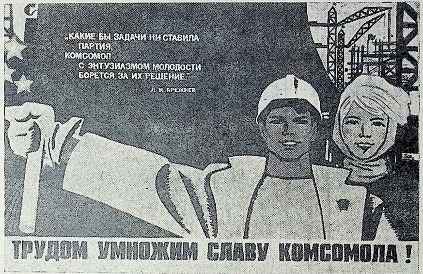
Плакат художника И. Компарца. Издательство «Плакат».