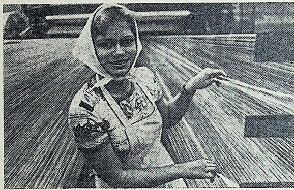
Комсомолки Даугавпилсского завода химического волокна имени Ленинского комсомола и Могилевского производственно-

И. ФРАНЦУЗОВ, председатель городского коллектива охотников.